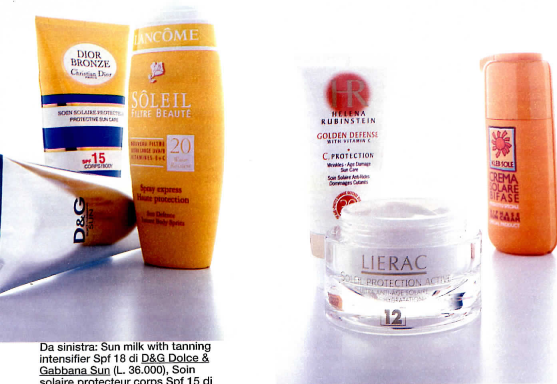
Da sinistra: Sun milk with tanning intensifier Spf 18 di D&G Dolce & Gabbana Sun (L. 36.000), Soir solaire protecteur corps Spf 15 di Dior Bronze Christian Dior (L. 42.500), Spray express haute protection Ip 20 di Sôleil filtre beauté Lancôme (L. 42.000).